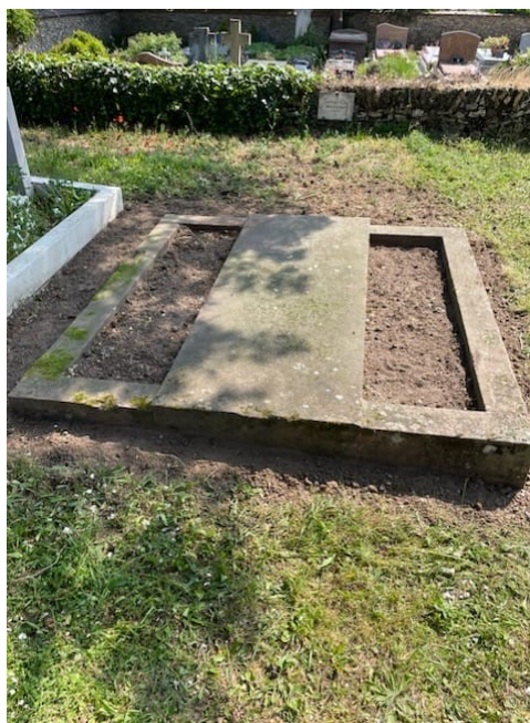
La tombe restaurée